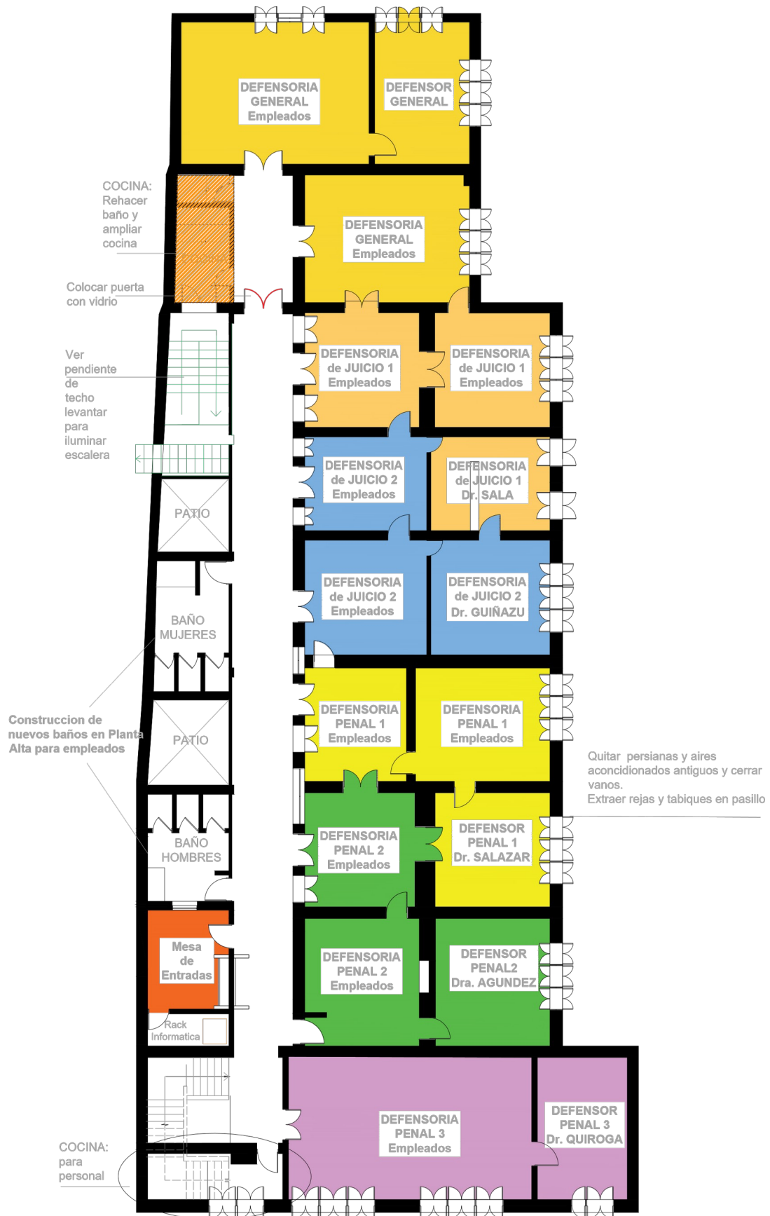
Edificio Anexo (Nuevo 2025)