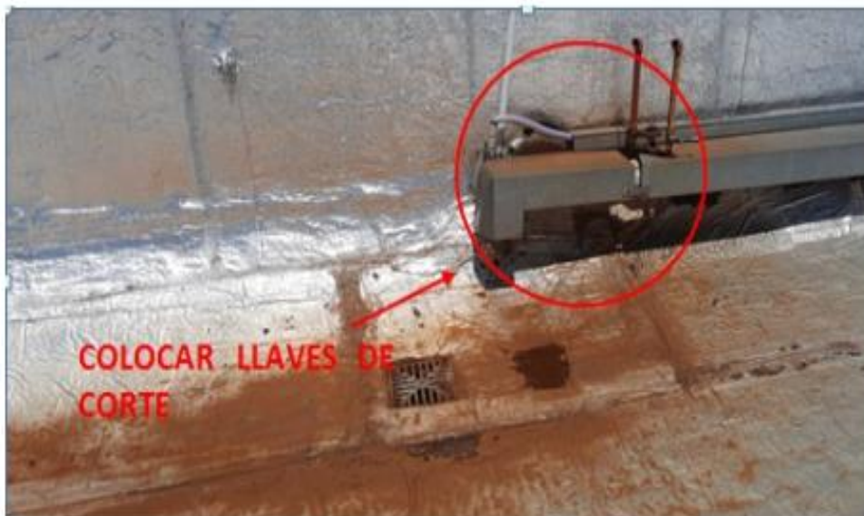
Ramal A – Bajada 2