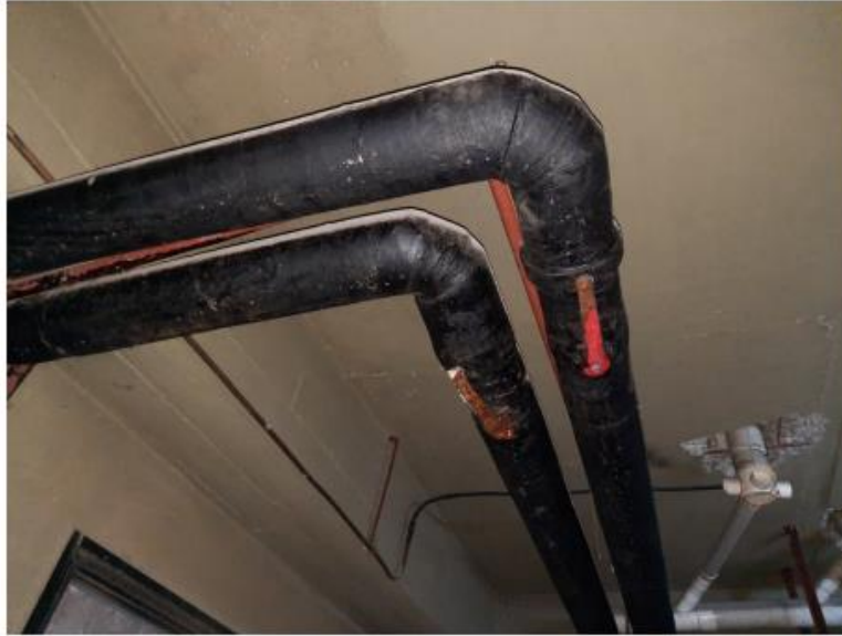
Válvula rota N°5 impulsión (ramal ala este): Válvula con pérdidas en el vástago (válvula de la izquierda).