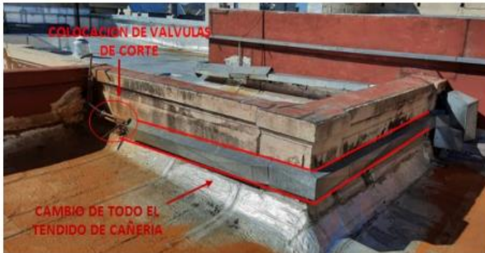
Ramal C – Bajada 5