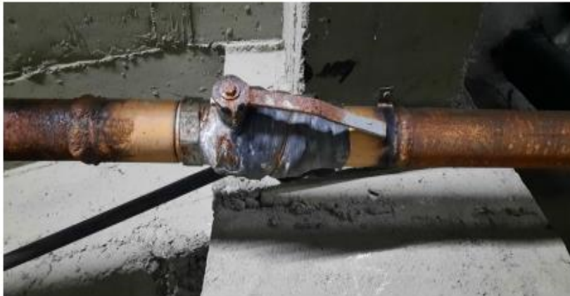
Válvula rota N°4 impulsión (ramal ala norte): palanca de accionamiento oxidada. Válvula con pérdida en vástago y rosca.