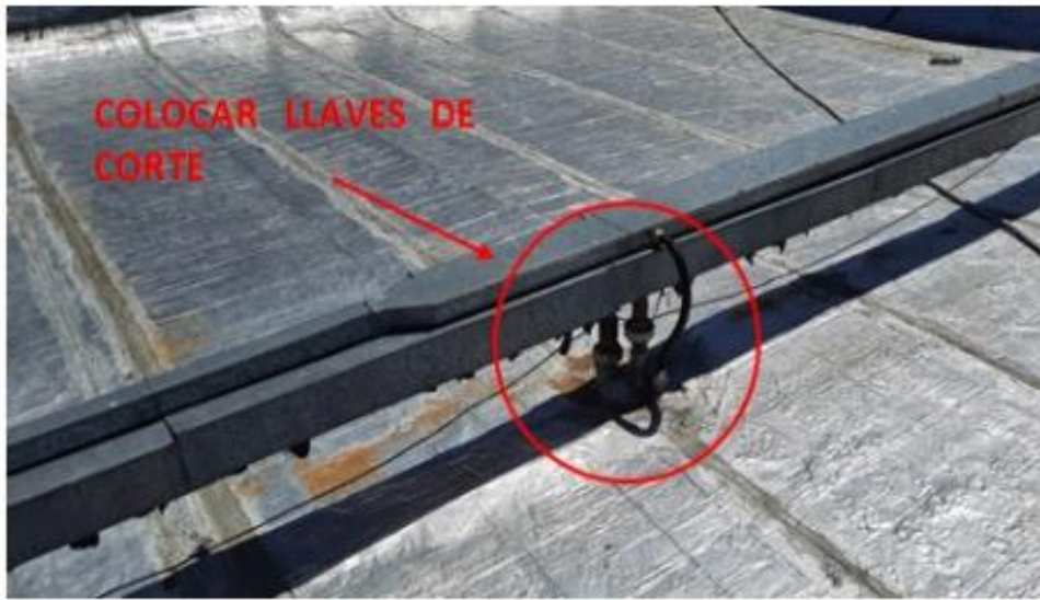
Ramal A – Bajada 1