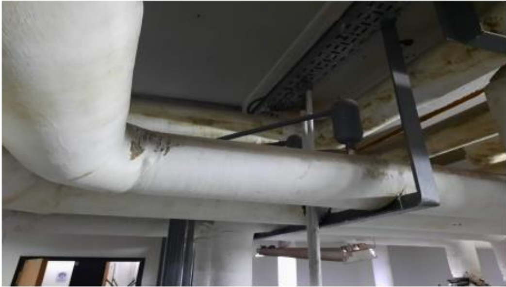
Purgadores con su respectiva cañería de desagüe.

En conclusión, será necesario ejecutar lo siguiente: