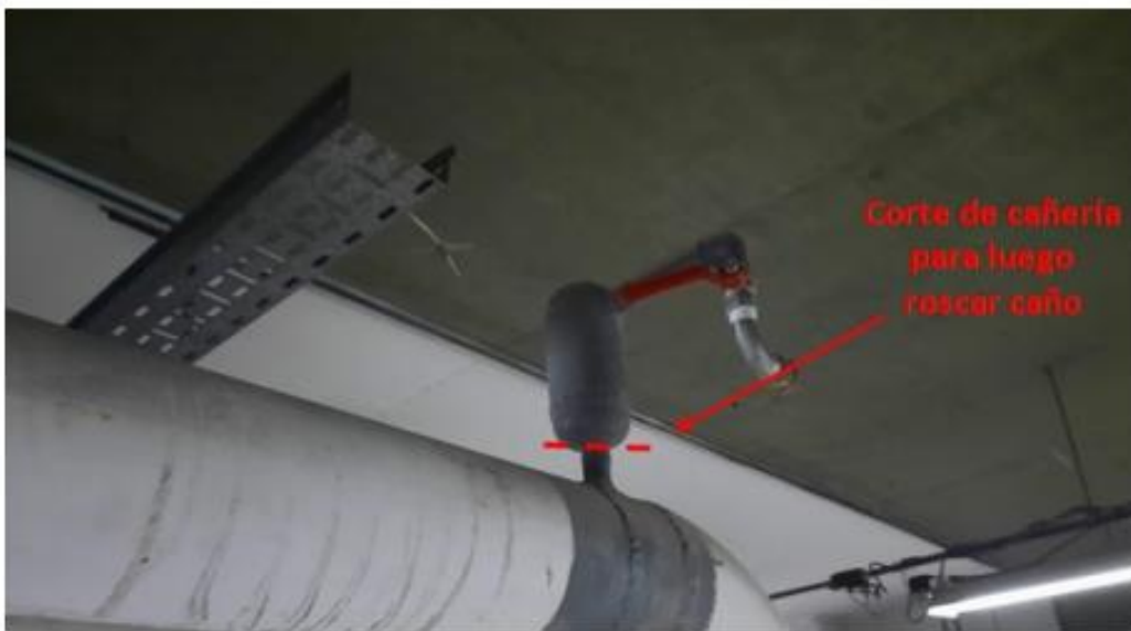
Corte de cañería, roscado e instalación de llave de corte de ½".