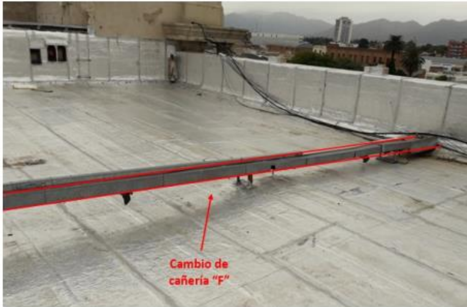
Ramal F – Bajadas 10.

No obstante, la cañería instalada, deberá cumplir con el requerimiento inherente a su función y deberá respetar el mismo diámetro o equivalente al caño retirado.