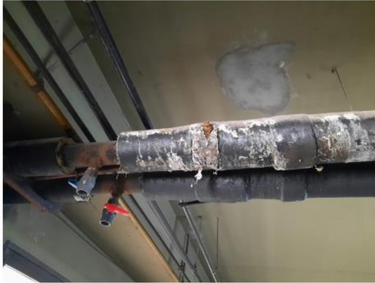
Válvula rota N°1 (ramal ala norte): Le falta palanca y presenta perdidas en la misma.