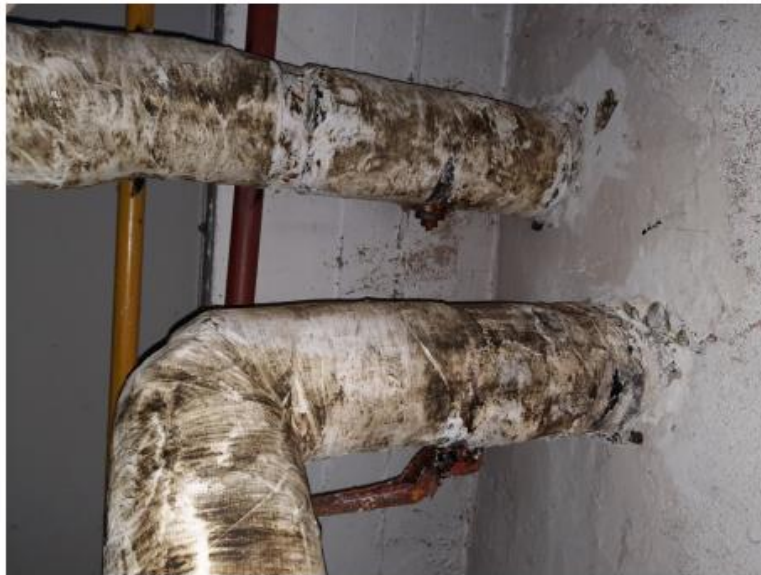
Válvula rota N°6 impulsión (ramal ala sureste): Válvula con pérdidas en el roscado y falta de vástago de accionamiento.

En virtud de lo informado, se deberá cambiar 6 (seis) válvulas de corte de 2". Estas valvular podrán ser roscada o soldadas. Bajo ningún punto de vista deberán ser roscadas a niples de caño de gas. Una vez instaladas, las válvulas deberán quedar totalmente aisladas.