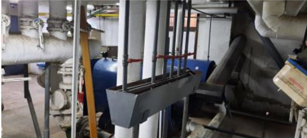
Bandeja recolectora del agua que expulsan los purgadores.

De esta manera, la cañería quedara preparada para la instalación de los purgadores automáticos que se encuentran en stock.