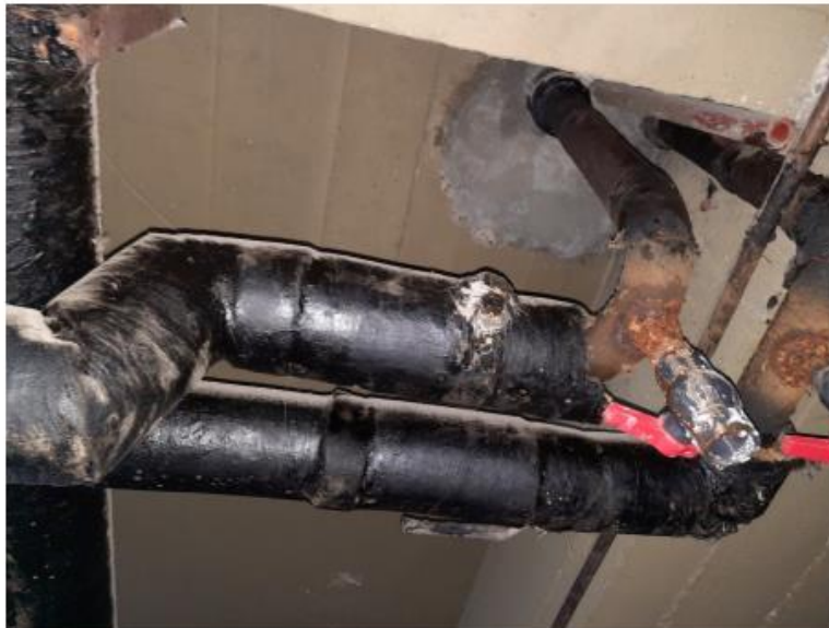
Válvula rota N°2 (ramal ala noroeste): Le falta palanca de accionamiento.