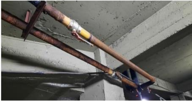
Válvula rota N°3 retorno (ramal ala este): Válvula con pérdidas en el roscado.